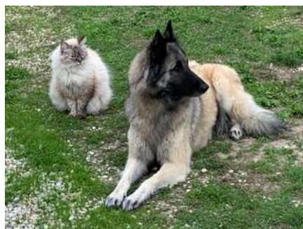
Duchesse et Nouchka