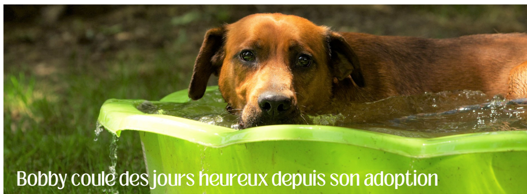
Bobby coule des jours heureux depuis son adoption